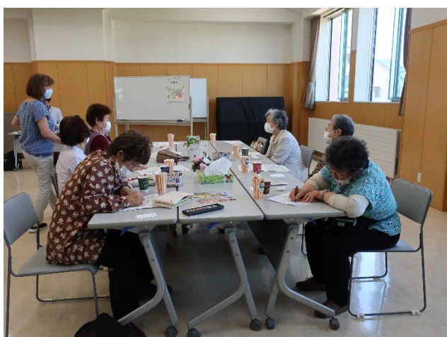
ベルデ君の塗り絵も好評です！

「マスクに、手指消毒、換気」と、少しずつ北海道スタイルに慣れてきて、皆さん上手に日常生活を取り戻してきているようです。今月は、皆さんリクエストにお答えして、「どん」と、参加者の皆さんが呼ぶとうきびのお菓子を用意してみました。マスクを少しずらしながら、皆さんポリポリと手が止まらない様です。マスク越しでもおしゃべりはやっぱり楽しいと、言わんばかりの笑顔。8月から実証運行される「乗り合いハイヤー」の説明にも、真剣に耳を傾けていました。