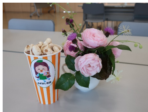
リクエストのお菓子「どん」