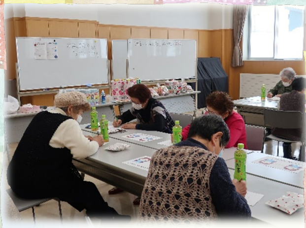
野菜を思い出しながら ビンゴカードを作っています

マスクを外す事無く、脳トレを兼ねた16の野菜名を書き出すビンゴゲームを楽しみ、手にした景品は様々な品で、今年の運だめしさながらでした。こんな時だからこそ、つながりを実感できる、小さな活動を続けて行きたいと思っています。