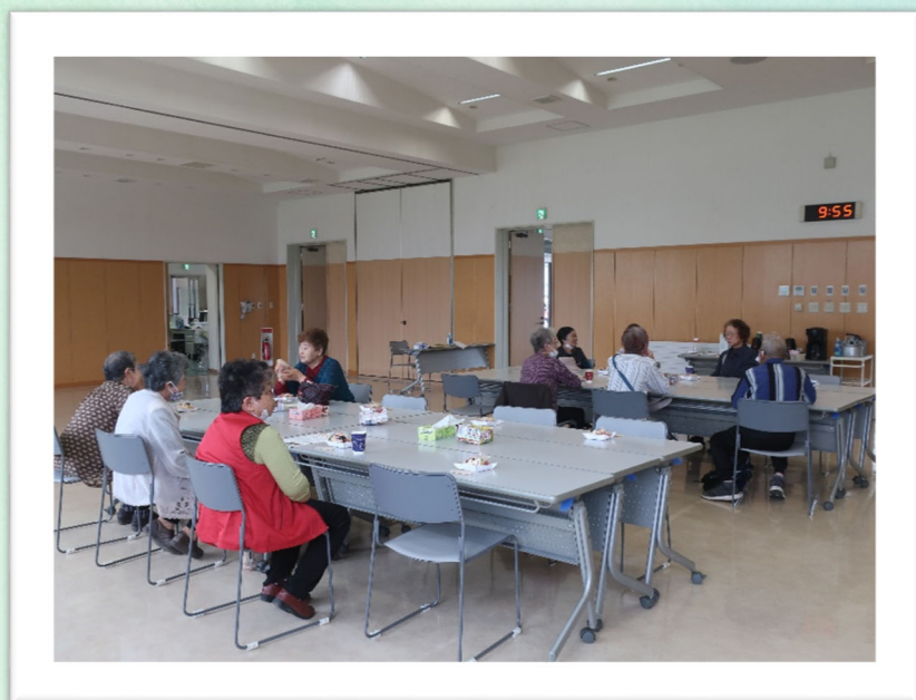
距離をとりつつ、久しぶりの再会におしゃべりがとまりません

前回の「あずまし茶屋」は、2月25日（火）でした。あの頃はまだ大きな口を開けて、おしゃべりが出来ましたが、雛祭り、卒業、入学、桜とカレンダーと共に過ぎてしまいました。とても長い巣ごもり時間でしたね。今日は全員がマスク姿ですが、笑っている目が見られて、皆さん嬉しいそうです。つかの間の楽しい時間を過ごせました。手洗い・マスク・3密回避と、もう少し頑張りましょう。