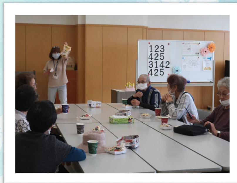
みんなで脳トレ、指体操！なかなか指が動きません（汗）